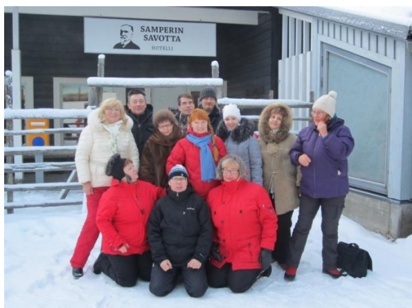
Туроператоры собрались в гостинице «Samperin Savotta»

В ноябре-декабре мы организовали тур по Восточной Лапландии для туроператоров, турагентств и журналистов юга Кольского полуострова с целью ознакомления с широким спектром туристических услуг. Программа была насыщенная, но удачно составлена, и участники получили самую свежую информацию о наших туристических объектах. Ожидаем положительных результатов от поездки!