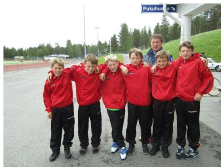
Мальчики-футболисты 14.–16.9.в Кемиярви ja 7.-9.12. в Кандалакше

на Белом море в Кандалакше, в футбольном лагере в Кемиярви, баскетбольном турнире в Салле, в Кемиярви в хоккейном турнире ветеранов. В декабре ребята КР-55:п ездили на турнир и для ознакомления в Кандалакшу. Дружеские контакты, налаженные в рамках поездок и мероприятий – те положительные результаты, которые не возможно посчитать в деньгах. Они позволяют знакомиться с новой культурой, воспитывать детей международной деятельности и устранять предрассудки.