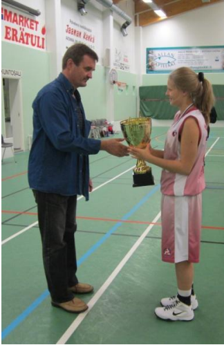
Кубок победителя капитану сборной Полярные Зори вручает Тапио Пелтопера

Значение имеет тот факт, что проведение спортивных мероприятий повышает спрос на имеющиеся спортивные услуги на местном уровне, а также они являются эффективным способом развития туризма в разных объектах.